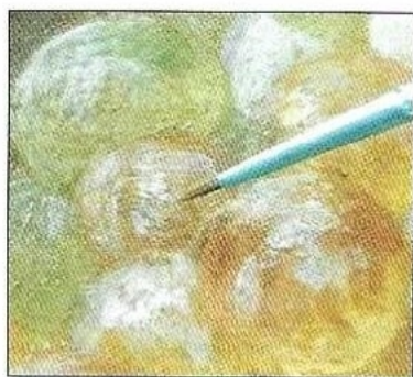
Réintégration picturale.

Si restaurer un tableau est à la fois une opération technique, qui vise à prolonger la vie d'une œuvre, elle est aussi une opération critique qui évolue toujours entre deux exigences: l'honnêteté historique et le plaisir esthétique. Le restaurateur-conservateur ne doit jamais oublier que sa tâche première « est non d'effacer toute trace de vieillesse et de vieillissement, mais de maintenir l'unité fragile de la peinture, et, surtout, de rester en paix avec le fantôme de l'artiste créateur » 8 .