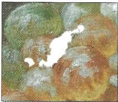
Lacune avant retouche.

Enfin, la dernière phase esthétique, réalisée sur l'œuvre, a été celle de la restauration de l'image, visant à lui rendre sa lisibilité. Cette réintégration picturale, s'est déroulée en deux phases, la première consacrée au masticage, la seconde à la retouche. Le masticage a permis de mettre à niveau, avec la surface de la peinture d'origine, les anciennes lacunes et de leur redonner « matière » en les modelant pour restituer au mieux les empâtements, coups de pinceau, craquelures. Puis la retouche, effectuée au moyen de couleurs créées pour la restauration et complètement réversibles, s'est efforcée de reconstituer, chromatiquement et graphiquement, l'image. Chacune de ces étapes a été précédée et suivie de la pose de différents vernis, répondants aux besoins de l'œuvre et aux exigences esthétiques et déontologiques.