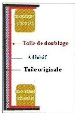
Schéma d'un doublage. © A. Monet.

Le traitement adapté était donc de consolider le support fragilisé en effectuant un doublage . Cette opération consiste à coller une toile neuve sur toute la surface du revers de la toile originale, au moyen d'un adhésif synthétique, qui ne pénètre pas dans la stratigraphie du tableau et permet, ainsi, la réversibilité de l'opération. Une fois le doublage mis en place, la toile originale, renforcée, peut être remise en tension sur son châssis sans risque de provoquer de nouvelles déchirures. Cependant, une telle opération de restauration nécessite un revers plan, dégagé de toutes irrégularités ou surépaisseurs.