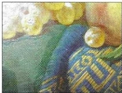
Tapis bleu après retrait du vernis.

Le décrassage effectué à sec, puis au moyen de solutions tampons 6 , a permis d'évacuer les saletés accumulées à la surface de l'œuvre. Quant au nettoyage, ou retrait du vernis et des repeints, il s'est fait au moyen de mélanges de solvants, préalablement sélectionnés et testés sur chacune des couleurs de la palette de Nature morte aux fruits . Cette opération a dévoilé toute la richesse du traitement pictural de cette nature morte, qui paraissait jusqu'alors plate et terne : l'éclairage précis et contrasté perçant le groupe de fruits, l'éclat lumineux des différentes textures, l'intensité du bleu du tapis, qui semblait auparavant si vert.